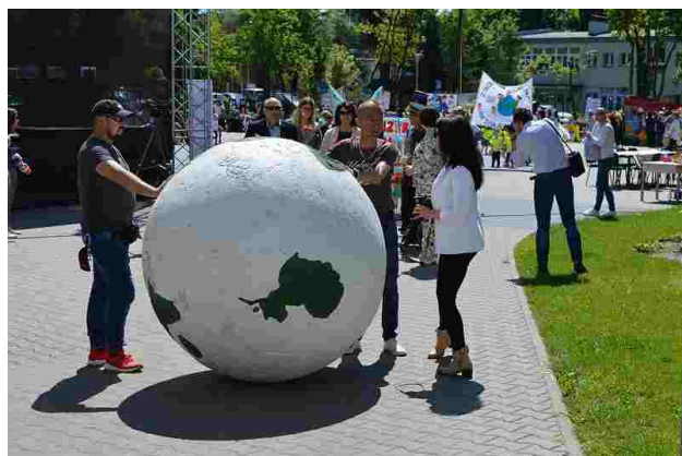
Za chwilę wyruszy przemarsz ulicami miasta

31 maja uczestniczyliśmy w „Jarmarku Ekologicznych Rozmaitości 2019” zorganizowanym przez Starostwo