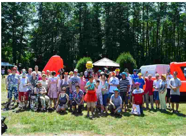
Pamiątkowe grupowe zdjęcie

W dniu 12 czerwca grupka naszych mieszkańców miło spędziła czas na pikniku integracyjnym w ŚDS Drzewociny, na który zostaliśmy zaproszeni. Była okazja do spotkania starych znajomych. Na wszystkich uczestników czekało wiele atrakcji. Można było wziąć udział w konkursach i zabawach sprawnościowych oraz potańczyć. Nie zabrakło również smacznego poczęstunku. Wracaliśmy bardzo zadowoleni.