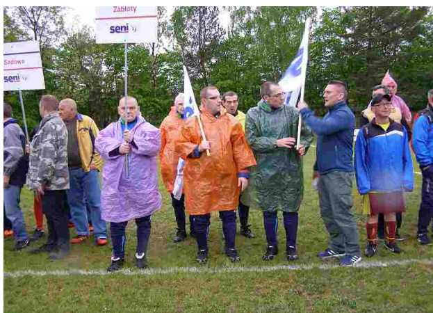
Deszcz, deszcz i jeszcze raz deszcz

Tegoroczne rozgrywki będą się nam kojarzyły z deszczem. Towarzyszył on