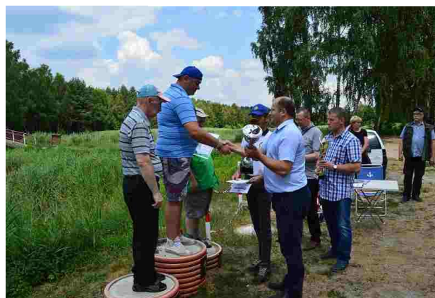
Wręczanie nagród zwycięzcom

dwunastu naszych mieszkańców, a także zaproszeni goście z gminy i powiatu. Dwie godziny aktywnego wędkowania przyniosły bardzo dobry efekt w postaci sporej ilości ryb. Pierwsze miejsce