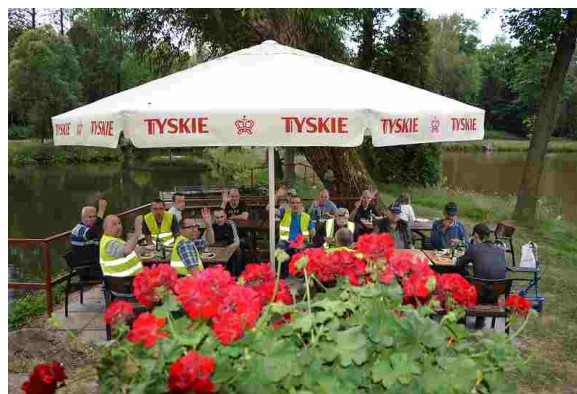
Było bardzo smacznie i miło

W dniu 28 czerwca grupa naszych mieszkańców udała się na smażoną rybkę do „Starego Młyna” w miejscowości Jamborek. Jest to miejsce, które czasami odwiedzamy chcąc zjeść smaczną smażoną rybkę. Pogoda w tym dniu dopisała, można więc było spokojnie na łonie przyrody kosztować pysznego pstrąga. Wszyscy wróciliśmy najedzeni i w dobrych humorach.