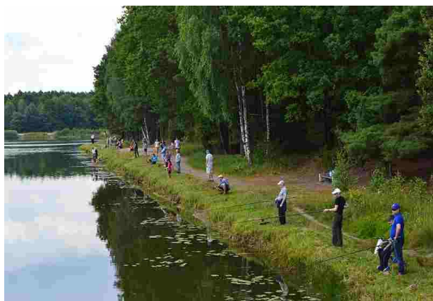
Uczestnicy na swoich wylosowanych stanowiskach

20 lipca br. nad zbiornikiem wodnym „Patyki” odbyły się po raz kolejny zawody wędkarskie. Dzięki pomocy i współpracy wędkarzy z koła nr 37 w Żelowie miło spędziliśmy czas nad wodą. W zawodach uczestniczyło