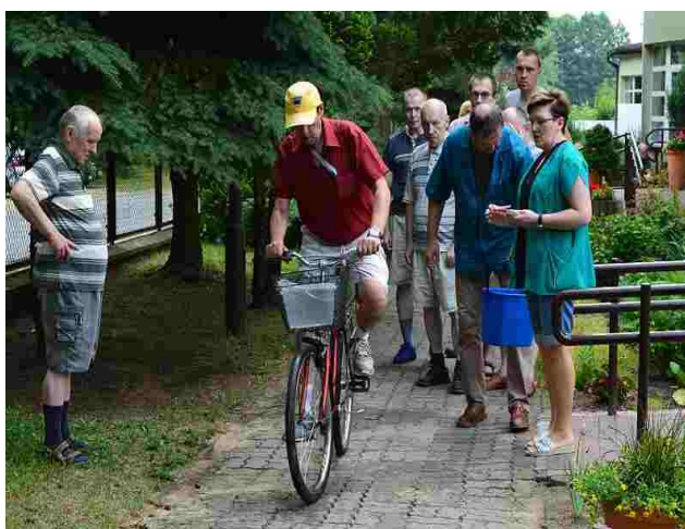
To był ostry start rowerem

W dniu 14 czerwca zostało zorganizowane w naszym domu symboliczne powitanie lata. W tym dniu było bardzo gorąco i słonecznie. Dla chętnych, którzy chcieli zmierzyć się w konkurencjach sprawnościowych przygotowano slalom na rowerze oraz rzuty piłką do kosza. Rywalizacja była bardzo zacięta, ale i tak liczyła się dobra zabawa. Wszyscy uczestnicy za udział w zawodach zostali obdarowani słodkimi upominkami.