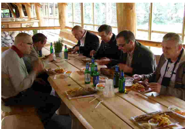
Jedliśmy i wspominaliśmy rozgrywki

W dniu 23 maja została zorganizowana wycieczka dla naszych piłkarzy do gospodarstwa agroturystycznego na Grobli, na smażoną rybkę. Okazją do wyjazdu było zdobycie przez naszą drużynę drugiego miejsca w turnieju rozegranym w Waplewie. Można było się zrelaksować, wspominać rozegrane mecze, strzelone gole i stracone sytuacje. Było bardzo miło i smacznie.