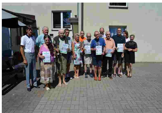
Wszyscy uczestnicy wędkarskiego spotkania