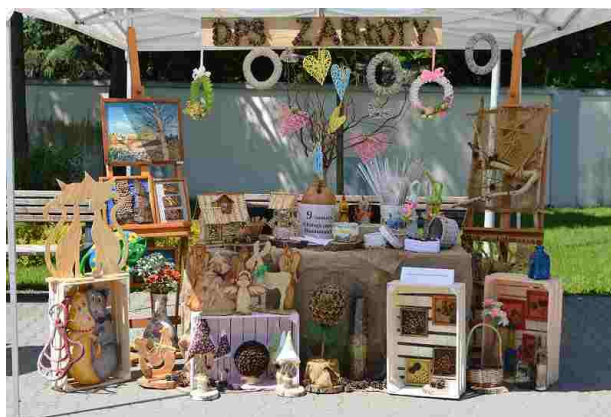
Nasze ekologiczne stoisko

zużytych produktów robiła wrażenie. Podczas obchodów zorganizowana została „Parada Wolności dla Ziemi 2019”, w której uczestnicy swoim wyglądem i transparentami chcieli zwrócić uwagę oraz wyrazić swój