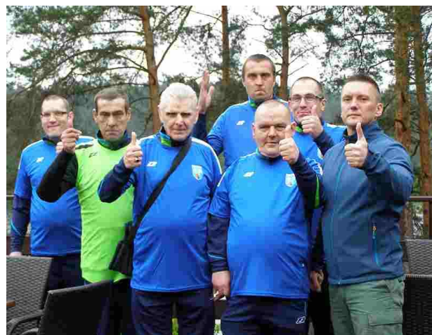
Optymizm nas nie opuszczał

wszystkich meczach wpuścił tylko dwa gole. Z rozegranych czterech meczy jeden został przegrany. Najtrudniejszy pojedynek nasi zawodnicy stoczyli