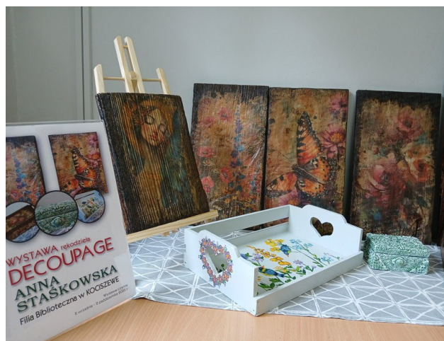
Obejrzeliśmy prace wykonane techniką decoupage