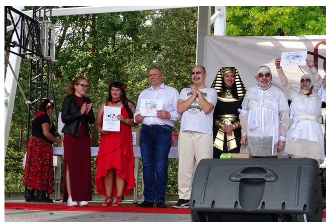
Wyróżnienie za najciekawszy występ artystyczny