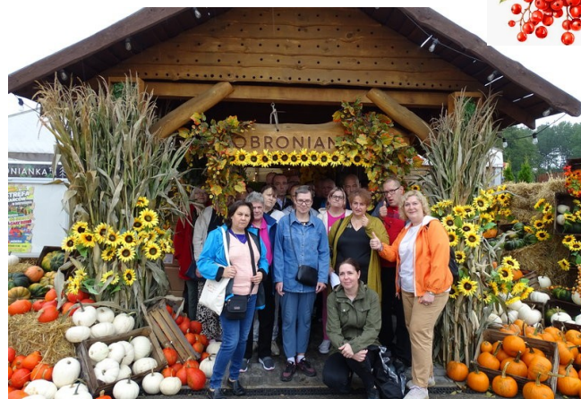
Przed wejściem do „farmy dyń”