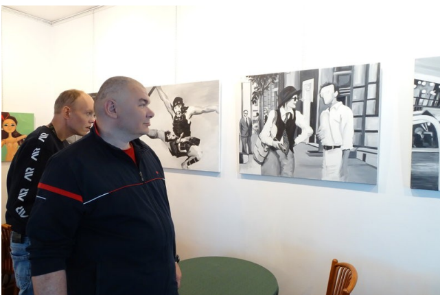
Panom spodobały się monochromatyczne prace...

Tosik zatytułowane „Odyseja”, które były w formie opowieści przekazanych na płótno. Po obejrzeniu wystaw znalazła się chwila na lody i rurki z kremem. Czas spędzony ze sztuką zaspokaja potrzebę rozrywki, dostarcza przyjemnych wrażeń i jest odskocznią od codzienności.