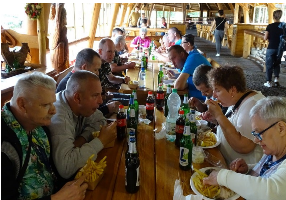
Zawsze wszystkim smakuje smażona rybka