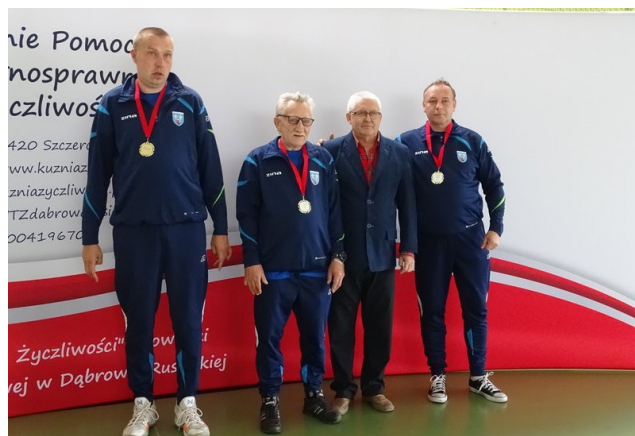
Nasi zawodnicy ze zdobytymi medalami