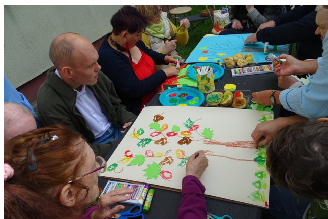
Wspólnie malujemy kolorowe, jesienne drzewa