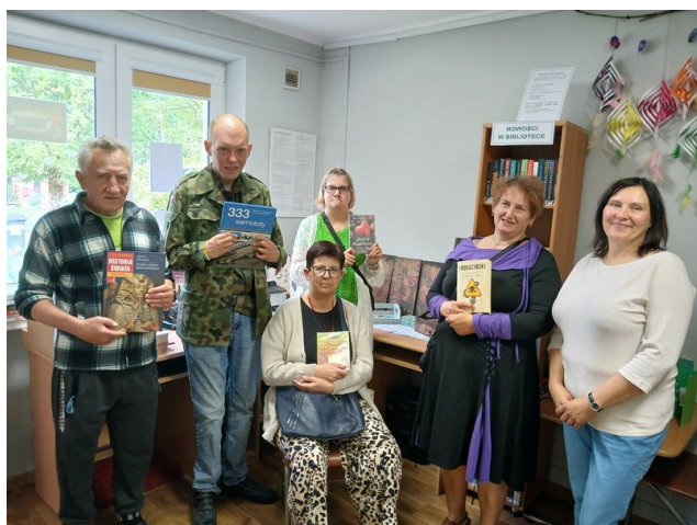
Mieszkańcy z wypożyczonymi książkami

8 września kolejna grupa naszych podopiecznych udała się z wizytą do Filii Bibliotecznej w Kociszewie. Podczas odwiedzin mieszkańcy rozmawiali z pracownikiem biblioteki o swoich zainteresowaniach, co pozwoliło dobrać odpowiednie książki do ich upodobań.