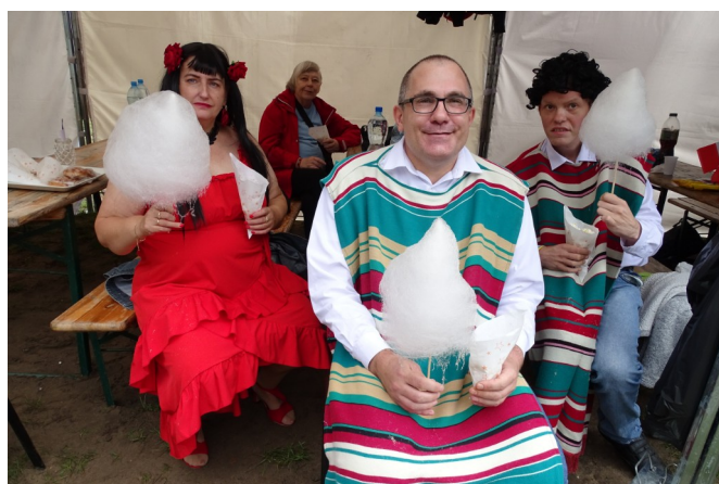
Czas na słodki poczęstunek