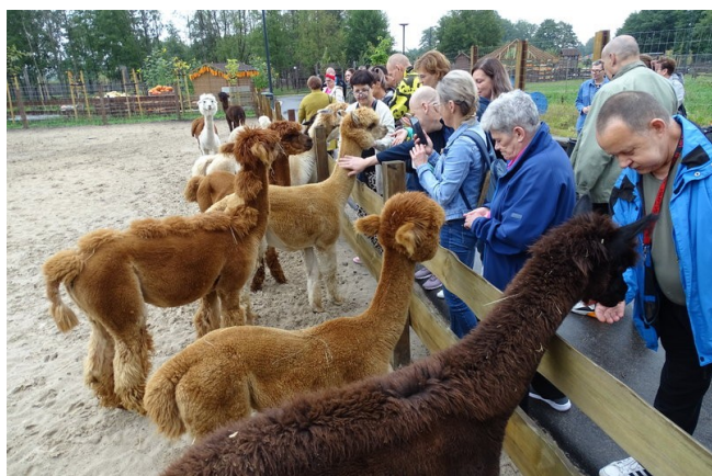
Atrakcją było karmienie alpaki i innych zwierząt

„Najbardziej mi się podobał spacer z panią przewodnik, od której dostałem marchewkę pokrojoną w talarki i miałem okazję karmić osiołka, wielbłądy jednogarbne (dromadery), alpaki oraz kózki. Widziałem też fenka, renifery, kangury, skunksy. Pani przewodnik opowiadała o tych zwierzętach, zadawała nam pytania oraz przekazywała różne ciekawostki. Po spacerze udaliśmy się na warsztaty, gdzie ozdabialiśmy dynie. Pani, która prowadziła zajęcia, dała nam materiały do dekorowania dyń. Pomysły mieliśmy różne i stworzyliśmy bardzo kolorowe prace, które zabraliśmy ze sobą do domu. Ja swoją dynię zabrałem do pokoju, postawiłem na półce i za każdym razem gdy na nią patrzę miło wspominam wycieczkę”.