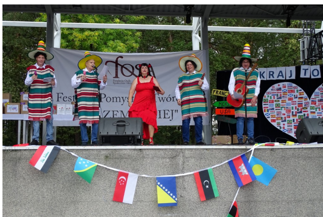
Nasza grupa „OTO-ONI” na scenie