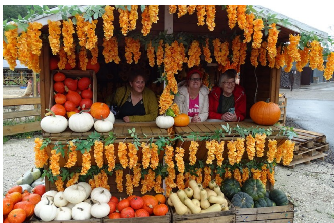
Mieliśmy okazję poznać różne odmiany dyni