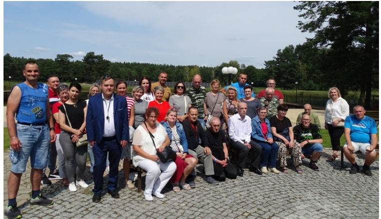
Pamiątkowe zdjęcie z wyjazdu na Groblę