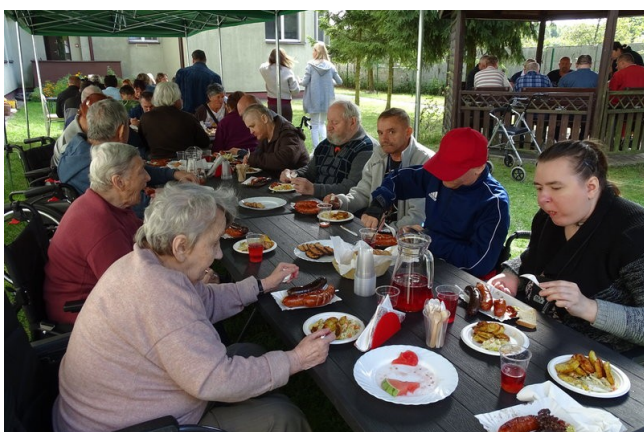
Najlepiej smakuje pieczony ziemniak z przyprawami

„Jesienne drzewa”, do których wykorzystano stemple zrobione z ziemniaków. Wszyscy doskonale się bawili, współpracowali i integrowali. Następnie nadszedł czas na wspólne biesiadowanie, podczas którego główną potrawą były pieczone ziemniaki oraz kielbasa i kaszanka z grilla. Na zakończenie imprezy nastąpiła symboliczna wymiana kolorowych prac oraz wręczono podziękowania. Dziękujemy za wspólnie spędzony czas i mamy nadzieję, że będzie jeszcze wiele okazji do spotkań.