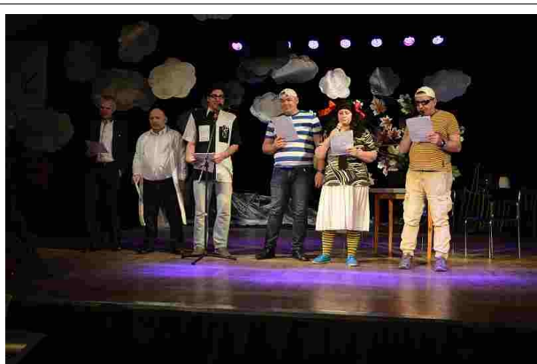
Po raz kolejny na łódzkiej scenie

7 listopada br. uczestniczyliśmy w XXII edycji Festiwalu Sztuk Wszelakich w Domu Kultury „Ariadna”. W tym roku w imprezie wzięło udział aż 36 placówek z województwa łódzkiego, mazowieckiego oraz gościnnie wystąpili artyści niepełnosprawni z Czech. Nasza grupa