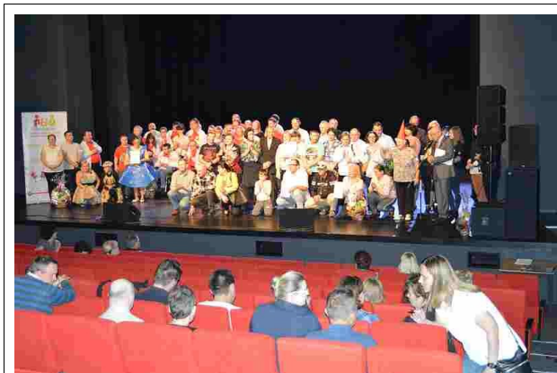
Wszyscy uczestnicy przeglądu na scenie

16 października br. w PGE Giganty Mocy w Miejskim Centrum Kultury w Bełchatowie odbył się XX Przegląd Twórczości Osób Niepełnosprawnych. Była