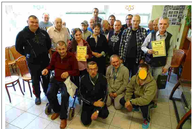
Mieszkańcy biorący udział w turnieju gier

24 października br. odbył się coroczny turniej dla wielbicieli gier stolikowych.