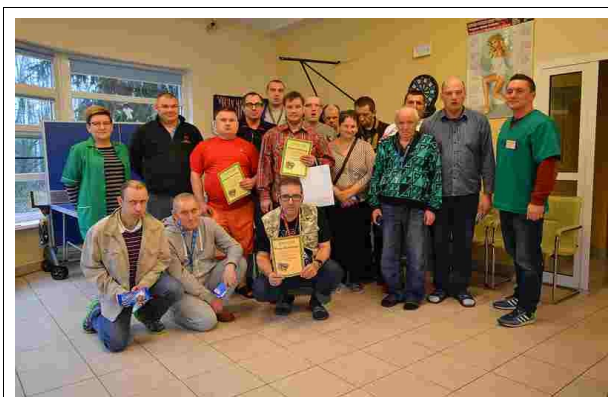
Tegoroczni uczestnicy rozgrywek tenisowych

20 listopada br. odbył się w naszym domu XIII Turniej Tenisa Stołowego, w którym