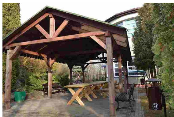
Jedna z nowych altanek

W miesiącach listopadzie i grudniu w naszym domu zostały zrealizowane trzy inwestycje. W ramach projektu została wykonana mała architektura ogrodowa. Na terenie ogrodu ustawiono dwie duże altany z wyposażeniem, wycięto stare drzewa i nasadzono nowe, posadzono krzewy oraz zamontowano nowe kosze. Wykonano również nowe pokrycie dachu terapii i stołówki oraz zamontowano na terenie budynku nową instalację przyzywowo-alarmową drogą radiową.