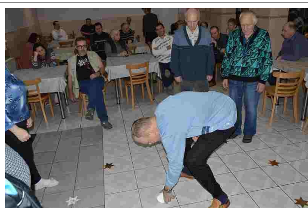
Ciekawe, która gwiazda przyniesie mi szczęście

29 listopada br. odbyła się w naszym domu zabawa „Andrzejkowa”. Zaczęliśmy od złożenia życzeń dla solenizantów, po czym