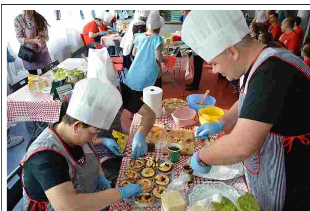
Takie pyszności, że tylko palce lizać

Nasza drużyna okazała się najlepsza w kategorii „Uciecha dla oczu i rozkosz podniebienia”. Atrakcją, która uświetniła to spotkanie kulinarne był pokaz carvingu, czyli dekoracji z warzyw i owoców. Na zakończenie wręczono dyplomy, upominki, a także degustowano przygotowane potrawy.