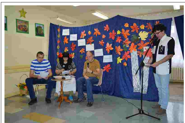
Nasza grupa „OTO-ONI” w przedstawieniu

29 października br. uczestniczyliśmy w spotkaniu na oddziale psychiatrycznym