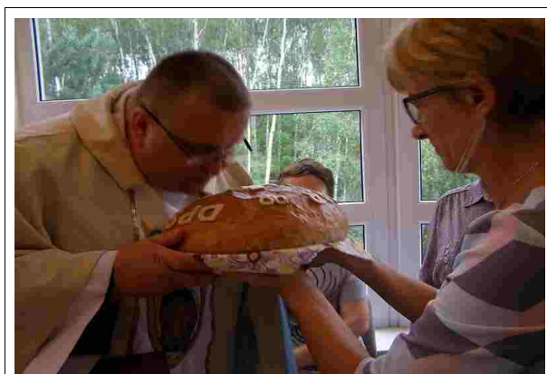
Dożynkowy bochen chleba