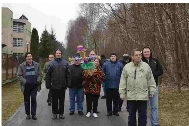
Idziemy pożegnać zimę

„Utopimy Marzannę szkaradną, niech z nią troski zimowe przepadną. Jeszcze chłodno, jeszcze błoto na razie, lecz na wierzbach widziałam dziś bazie. A wczoraj widziałam przebiśnieg, wkrótce pierwsze rozwiną się liście. Chodźmy, chodźmy Marzannę wyrzucić! Niech śnieg z mrozem już nie wróci. Pójdziemy wesolo ze śpiewem radosnym, bo dziś musimy poszukać wiosny...”