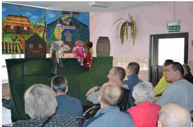
Wszyscy byli wpatrzeni w kolorowe kukielki

15 lutego br. mieliśmy okazję obejrzeć występ aktorów z teatru lalek TOMCIO z Nowego Sącza. Zaprezentowali oni