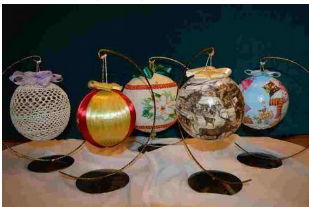
Bombki na aukcję WOŚP

Już po raz piąty braliśmy udział w szlachetnej akcji Wielkiej Orkiestry