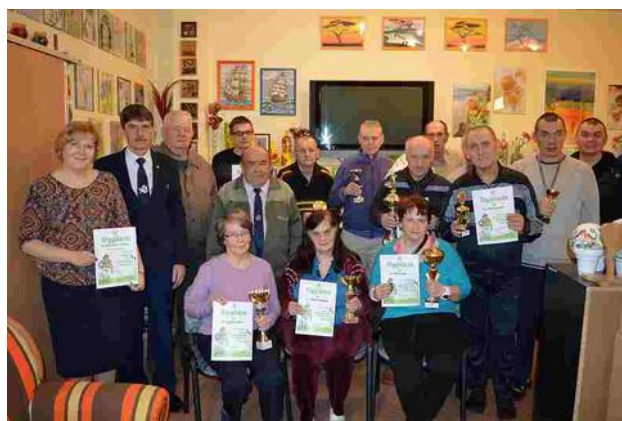
Wspólne, pamiątkowe zdjęcie

i ciekawe, wykonane różnymi technikami. Wszyscy autorzy zostali nagrodzeni, otrzymali puchary oraz pamiątkowe dyplomy. Spotkanie przebiegło w miłej atmosferze, a prezes