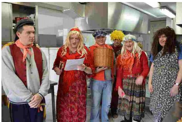
Z wizytą w kuchni

28 lutego br. na zakończenie karnawału odbyła się w naszym domu zabawa ostatekowa. Grupka mieszkańców z pracownikami, poprzebierani w barwne