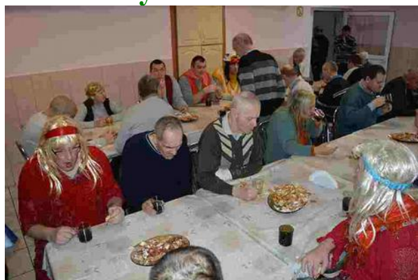
Po zabawie czas na słodki poczęstunek

stroje, przeszła kolorowym korowodem przez pomieszczenia naszego domu. Wszędzie gdzie pojawiali się wzbudzali śmiech oraz zainteresowanie innych mieszkańców i reszty personelu. Wszyscy zostali obdarowywani słodkimi