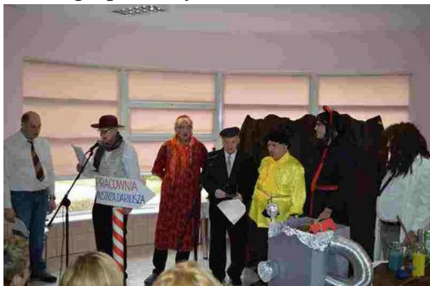
Panowie w trakcie przedstawienia

8 marca tradycyjnie kobiety obchodzą swoje święto. Z tej okazji, aby umilić ten dzień, grupa muzyczno - teatralna „OTO