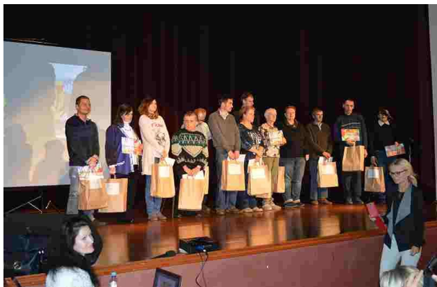
Laureaci konkursu podczas rozdania nagród

7 października br. grupka mieszkańców naszego domu biorąca udział w konkursie plastycznym pn. „Kolorowy Świat” odwiedziła Łaski Dom Kultury. Podopieczni uczestniczyli w ogłoszeniu