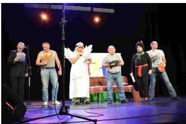
Nasza grupa teatralna podczas przedstawienia

10 października br. uczestniczyliśmy w corocznym przeglądzie twórczości na bełchatowskiej scenie teatralno - widowiskowej PGE Giganty Mocy. Wśród wielu ośrodków zaproszonych na występy nie zabrakło oczywiście naszej grupy muzyczno - teatralnej „OTO