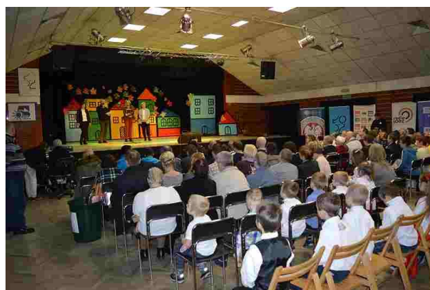
Publiczność w tym roku nie zawiadła

brawami. Widać było jak potrzebne i pożyteczne są tego typu spotkania. Cała impreza, jak podkreślają organizatorzy, ma na celu właśnie integrację osób