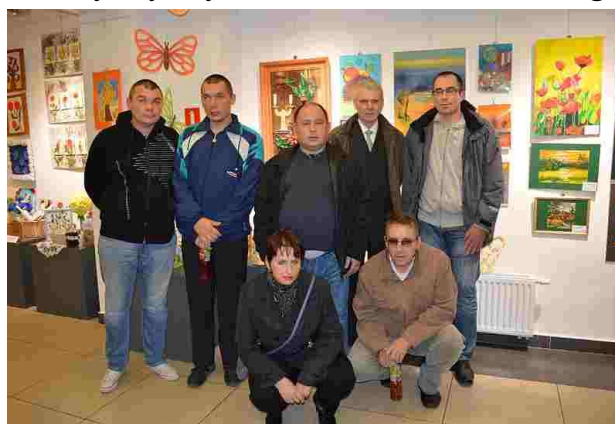
Na wystawie prac plastycznych

na zdrowy sposób odżywiania, dbanie o sprawność fizyczną oraz higienę osobistą. Nasz występ został bardzo dobrze przyjęty przez zgromadzoną publiczność. Po zakończeniu przeglądu udaliśmy się do pobliskiej galerii MCK, aby obejrzyć prace plastyczne wystawione przez inne placówki.