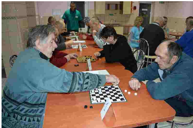
Podczas rozgrywek w warcaby

20 października br. w naszym domu odbył się jubileuszowy turniej gier stolikowych. Wzięło w nim udział dwudziestu mieszkańców. W tym roku