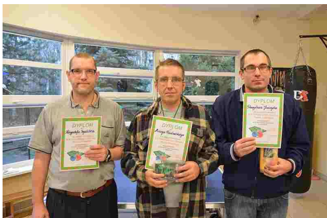
Tegoroczni zwycięzcy z dyplomami

16 listopada br. już po raz dziesiąty w naszym domu odbył się turniej tenisa.