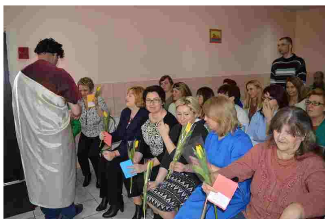
Kwiatek i laurka w tym dniu dla każdej Kobiety