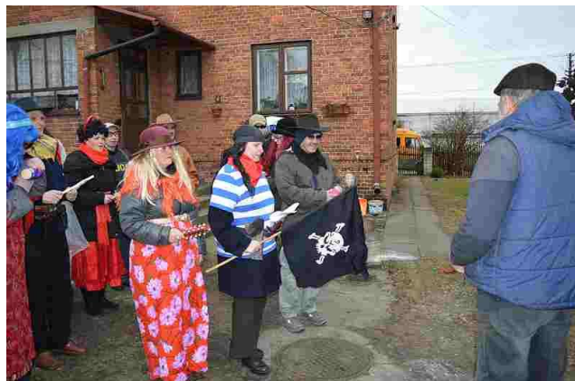
Okoliczni mieszkańcy chętnie nas gościli

z zadowoleniem, a okoliczne rodziny częstowały przebierańców przysmakami lub