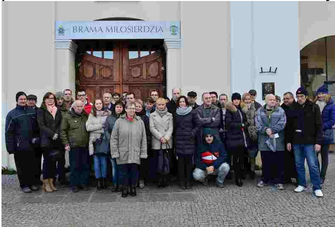
Wspólne zdjęcie u Bramy Miłosierdzia