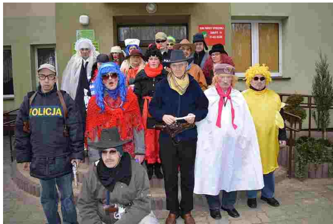
Przebierańcy w pełnej krasie

9 lutego br. w ostatni dzień karnawału mieszkańcy naszego Domu pamiętali o ostatekowej tradycji. Jak co roku przebierając się w przeróżne postacie wyruszyli kolorowym korowodem po najbliższej okolicy, odwiedzając mieszkańców Zabłot i Karczm. I tym razem wszędzie zostali przyjęci ciepło oraz