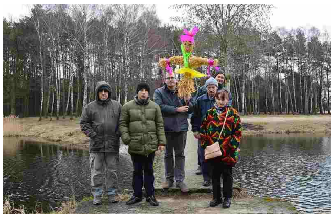
Żegnanie zimy nad zbiornikiem „Patyki”

21 marca br. grupka mieszkańców udała się nad zbiornik „Patyki” koło Zelowa, aby powitać wiosnę. W tym celu na terapii przygotowana została słomiana Marzanna, która symbolizowała zimą. Zgodnie z coroczną tradycją kukła została spalona i wrzucona do wody. Od tej chwili będziemy oczekiwać nadejścia upragnionej i ciepłej wiosny.