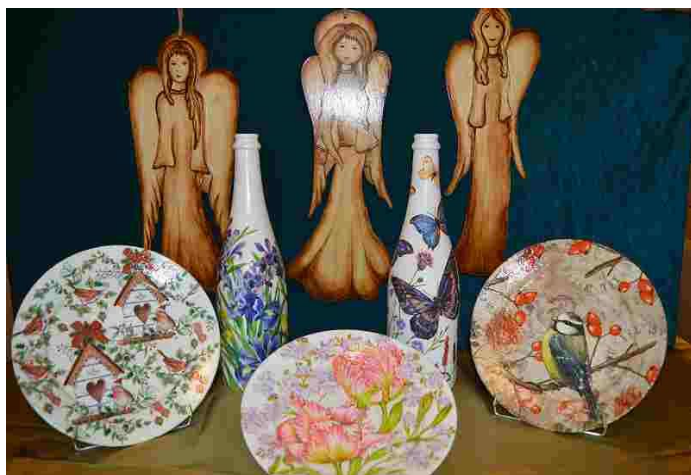
Nasze prace na aukcję 24 finału WOŚP

W styczniu br. na terapii zajęciowej przygotowane zostały prace plastyczne, wykonane ze sklejk i techniką decoupage, które później zostały wystawione na aukcję 24 Finału Wielkiej Orkiestry Świątecznej Pomocy. W tym roku zebrane środki zostały przeznaczone na wsparcie pediatrii i godnej opieki ludzi w podeszłym wieku. Cieszymy się, że w ten sposób możemy po raz kolejny wspierać akcję WOŚP.