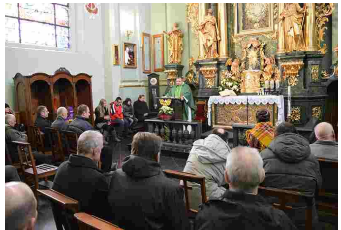
Wspólna modlitwa w Kaplicy Najświętszej Maryi Panny