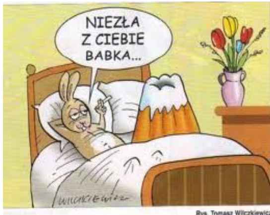
Rys. Tomasz Wilczkiewicz