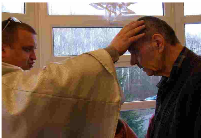
Błogosławieństwo na Dzień Chorego