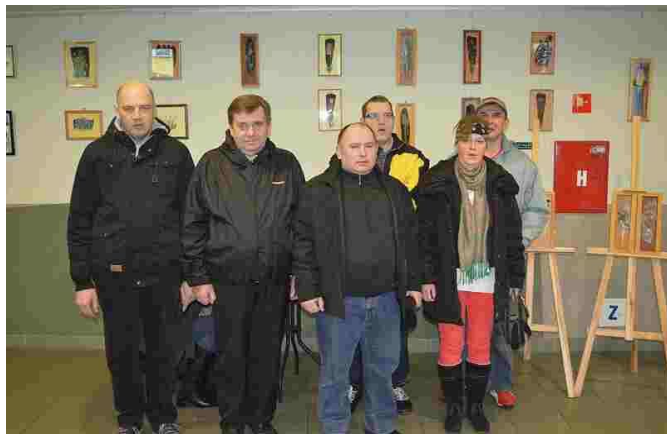
Na wystawie „Magia ptasich piór”

18 lutego br. mieszkańcy naszego Domu zwiedzili dwie interesujące wystawy. Jedna z nich nosiła tytuł „Magia ptasich piór”, i wystawiona była w Miejskiej i Powiatowej Bibliotece w Belchatowie, a jej autorką była