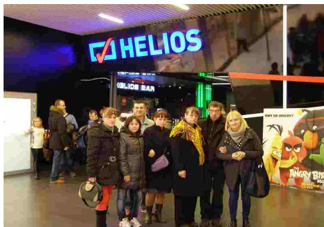
Wspólne zdjęcie przed seansem

16 lutego br. grupka naszych mieszkańców skorzystała z możliwości wyjazdu do kina HELIOS w Bełchatowie. Była wyświetlana polska komedia romantyczna pt. „Planeta Singli”, opowiadająca o szukaniu partnera życiowego przez internet i wyśmiewająca naiwność kobiet poszukujących ideału mężczyzny. Film wprowadził wszystkich w dobry humor za sprawą świetnych dialogów oraz znakomitej obsady aktorskiej, między innymi: Macieja Stuhra, Tomasza Karolaka, Agnieszki Więdłochy.