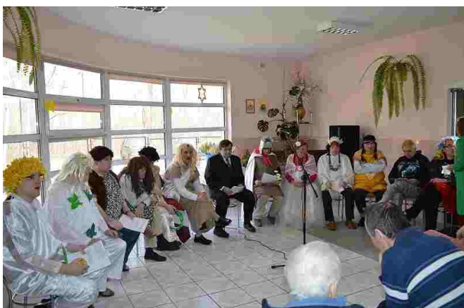
Przedstawienie czas rozpoczęć...

spodobało, śmiechu było co niemiara, a cały występ został nagrodzony gromkimi brawami. Na zakończenie panowie wręczyli wszystkim Paniom symboliczny kwiatek oraz własnoręcznie wykonane laurki. W podziękowaniu wszyscy zostali zaproszeni na słodki poczęstunek.