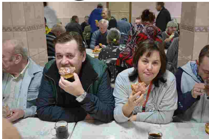
Takim słodkością nikt się nie oprze

4 lutego br. w ostatni czwartek karnawału, jak nakazuje tradycja, na stołach muszą królować pączki. Tak też i było w naszym Domu. W tym dniu wszyscy mieszkańcy i pracownicy mogli bezkarnie objadać się pączkami oraz faworkami. Po słodkim poczęstunku, przy skocznej muzyce, można było pozbyć się nadmiaru kalorii. Jak zawsze w tym dniu było bardzo słodko i miło.