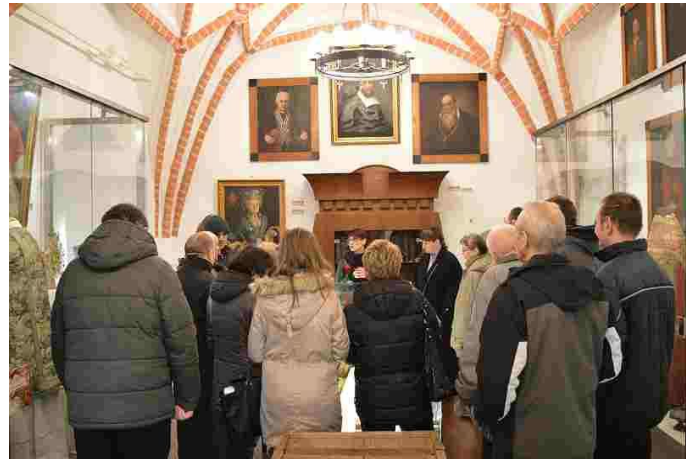
Zwiedzanie Muzeum Parafialnego

Nasze odwiedziny w Łasku zbiegły się z Jubileuszowym Rokiem Miłosierdzia 2015-2016 ustanowionym przez Ojca Świętego Franciszka. Podczas naszej wizyty przeszliśmy przez Bramę Miłosierdzia, uczestniczyliśmy we Mszy Św. oraz zwiedziliśmy zabytkowy kościół i mieszczące się nad zakrystią małe muzeum parafialne.