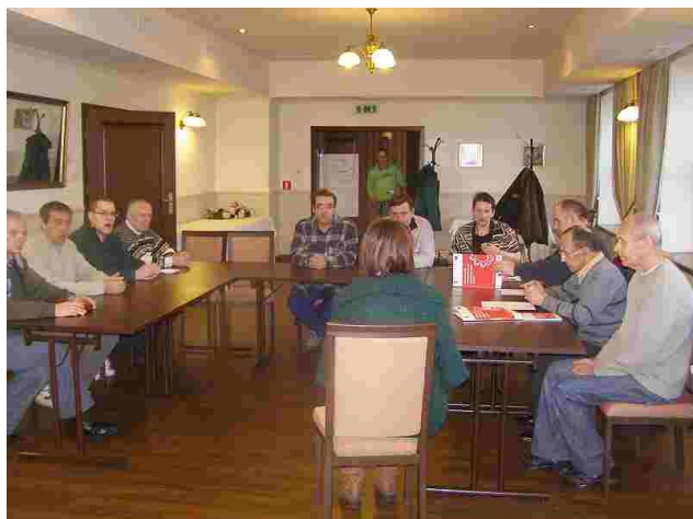
Zajęcia upływały w miłej atmosferze

W dniach 8 - 12 grudnia br. grupa 11 mieszkańców naszego domu wzięła udział w warsztatach wyjazdowych w ramach projektu „Wsparcie osób niepełnosprawnych ruchowo na rynku pracy IV” zorganizowanych przez Caritas Polska.