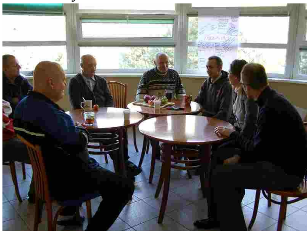
Uczestnicy w trakcie zajęć

W dniach 27-29 października br. mieszkańcy naszego domu mieli okazję uczestniczyć w warsztatach zorganizowanych przez Caritas Polska, w ramach projektu „Wsparcie osób niepełnosprawnych ruchowo na rynku pracy IV”. A oto jak warsztaty wspominają nasi mieszkańcy: