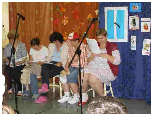
Pacjenci oddziału w scenie kabaretowej

w ramach terapii zajęciowej oraz na słodki poczęstunek. Nasi mieszkańcy tak wspominają ten dzień: