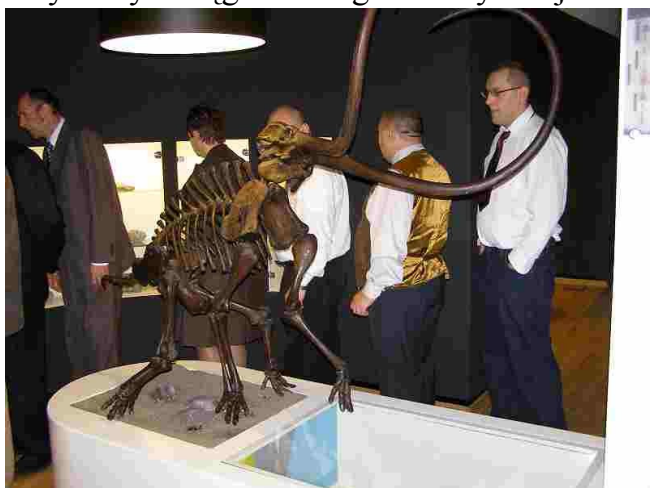
Jedna z wielu atrakcji wystawy

13 października br. mieszkańcy naszego domu uczestniczyli po raz kolejny w przeglądzie twórczości w Bełchatowie. W tym roku po raz pierwszy przegląd odbył się na scenie teatralno - widowiskowej nowego budynku PGE Giganty Mocy Miejskiego Centrum Kultury w Bełchatowie. Na dużej scenie swoją twórczość zaprezentowało trzynaście ośrodków, między innymi z Bełchatowa, Piotrkowa, Sulejowa, Drzewocin, Walewic i Łochyńska. Organizatorzy spotkania, Powiatowe Centrum Pomocy Rodzinie w Bełchatowie, przygotowało dla zaproszonych gości atrakcję w postaci zwiedzania nowego obiektu muzeum Giganty Mocy i obejrzenia multimedialnej wystawy o węglu i energii elektrycznej.