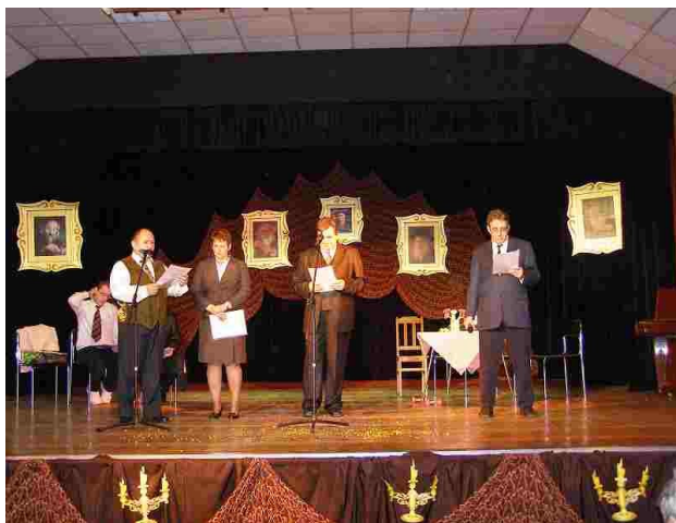
Nasza grupa swobodnie czuje się na scenie

6 listopada br. mieszkańcy naszego domu zaprezentowała się na przeglądzie teatralno - estradowym podczas festiwalu w Łodzi.