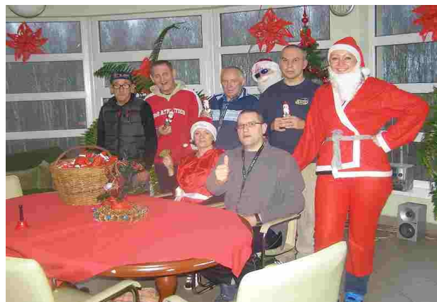
Pamiątkowe zdjęcie z Mikołajem

Zgodnie z tradycją 6 grudnia br. w naszym domu zagościł Mikołaj w otoczeniu Mikołajek. Mieszkańcy z radością przywitani gości, po czym wszyscy otrzymali po słodkim upominku, czekoladowym Mikołaju. Jak co roku było dużo śmiechu, a dobry humor nie opuszczał w tym dniu nikogo.