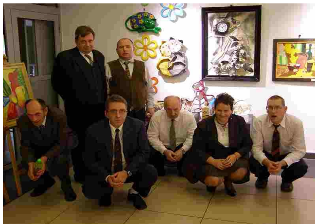
Mieszkańcy przy ekspozycji naszych prac w galerii MCK

skamieliny. Z występów najbardziej spodobało mi się przedstawienie pt. „Człowiek kamienia łupanego”. Podczas naszego występu bardzo się denerwowałam, ale gdy usłyszałam brawa publiczności zrobiło mi się bardzo przyjemnie. Cały ten czas spędzony na przeglądzie uważam za udany”,