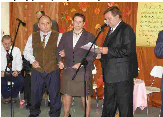
Mieszkańcy DPS podczas swojego występu