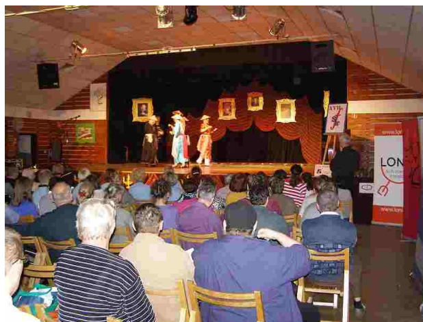
FSW budzi coraz większe zainteresowanie

p. Urszula: „W tym roku występy wspominam bardzo miło. Publiczność po naszym występie biła duże brawa i widać było, że nasz występ podobał się. Obejrzałam z zainteresowaniem