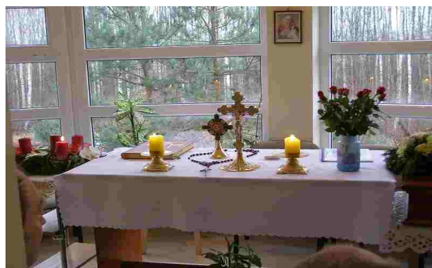
Relikwie w naszej kaplicy

Dnia 05.12.2014r. dostąpiliśmy zaszczytu przyjęcia w nasze skromne progi Relikwii Św. Jana Pawła II. Relikwie przybyły do naszej Kaplicy z Kościoła w Kociszewie w asyście straży pożarnej, Księdza Proboszcza oraz okolicznych parafian. W uroczystościach brali również udział mieszkańcy i pracownicy DPS - u.