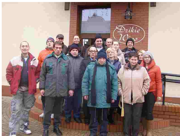
Wspólne pamiątkowe zdjęcie przed ośrodkiem