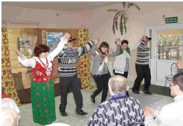
Góralskie klimaty potrafią wszystkich rozbawić

Koniec listopada to czas, gdy jak co roku organizowana jest zabawa andrzejkowa. 28 listopada br. mieliśmy przyjemność bawić się wspólnie z zaproszonymi gośćmi