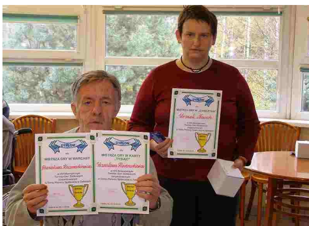
Tegoroczni Mistrzowie Gier Stolikowych i drobne upominki.