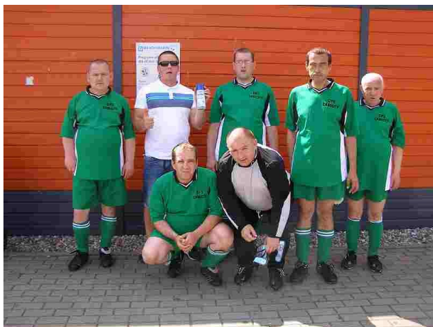
Nasza reprezentacja na SENI

W dniach 2-4 lipca br. reprezentacja piłkarska naszego domu uczestniczyła w Finałowym Turnieju Międzynarodowej Ligi Piłki Nożnej Osób Niepełnosprawnych SENI CUP. Zgodnie z tradycją cały turniej rozpoczęła barwna parada, która prowadziła ulicami Starego Miasta Torunia. Po dotarciu do sceny Muzeum Etnograficznego nastąpiło oficjalne powitanie gości oraz występy artystów cyrkowych. W tym roku wzięło udział aż 300 piłkarzy z dziesięciu krajów. W tak miłej atmosferze minął pierwszy dzień pobytu w Toruniu. Drugi dzień rozpoczął się od rozegrania meczów obserwowanych i przydzielenia zawodników do poszczególnych grup sprawnościowych. Nasi zawodnicy zakwalifikowali się do grupy D, w której rozegrali 3 mecze, z czego udało im się wygrać jeden. W drugim dniu turnieju jeden mecz zakończył się zwycięstwem, a drugi przegraną. Po tych zaciętych pojedynkach piłkarskich nasza drużyna zajęła czwarte miejsce, co wywołało pewien niedosyt oraz