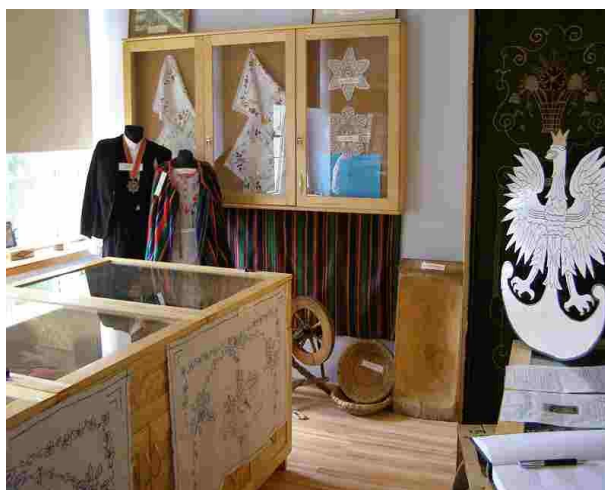
Część wystawy z Sali Tradycji Ziemi Dłutowskiej

podobało. Obejrzałam też wystawę o lasach oraz Salę Tradycji Ziemi Dłutowskiej. Zainteresowały mnie gabloty ze starymi maglownicami. Na półkach stały stare żelazka na duszę, lampy naftowe, stare garnki, kołowrotek, tara do prania oraz maszyna do szycia. Bardzo spodobały mi się kobiece stroje ludowe, haftowane serwetki, obrusy, robione ręcznie kapy i narzuty. Skorzystałam też z przejażdżki bryczką, przypomniały mi się wtedy lata mojego dzieciństwa. Ten dzień był udany i mile spędzony”.