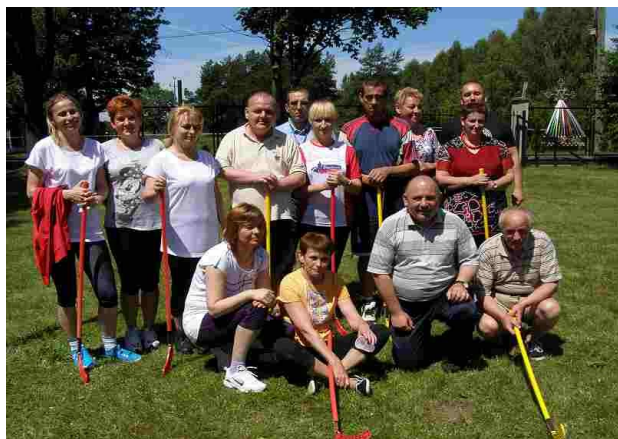
Wszyscy zawodnicy zadowoleni z remisu

Spragnieni ciepła i słońca 18 czerwca powitaliśmy upragnione lato. Zgodnie z tradycją naszego domu, po raz czwarty, odbył się mecz hokeja na trawie pomiędzy pracownikami, a mieszkańcami. Pogoda