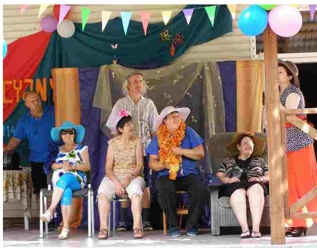
Nasza podopieczna choć przez chwilę mogła poczuć się jak aktorka, biorąc udział w spektaklu