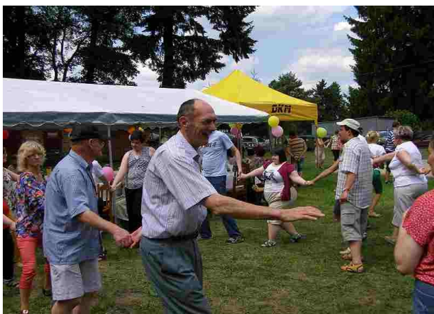
Na pikniku nie zabrakło wspólnej zabawy

16 lipca br. mieszkańcy naszego domu zostali zaproszeni na spotkanie zorganizowane przez Środowiskowy Dom Samopomocy w Drzewocinach. Organizatorzy zapewnili zaproszonym gościom wiele atrakcji. Jedną z nich był występ aktorów z Krakowa ze spektaklem „Szaleństwa panny Róży”, w którym brała również udział zgromadzona publiczność. Można także było przejechać się bryczką, zwiedzić Salę Tradycji Ziemi Dłutowskiej oraz obejrzeć wystawę pn. „90 lat Lasów Państwowych” przygotowaną przez nadleśnictwo w Kolumnie. Mimo panującego upału wszystkim uczestnikom dopisał wyśmienity humor. Letni piknik na pewno pozostanie miłym wspomnieniem.