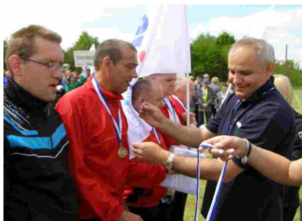
Najprzyjemniejsza chwila na turnieju

zakwalifikowali się do finału , który odbędzie się w Toruniu. Oprócz sportowej rywalizacji wszyscy zawodnicy wraz z opiekunami mogli uczestniczyć w ognisku integracyjnym, w klimatach dzikiego zachodu. Wspaniała atmosfera, przepiękna okolica i widoki, sprzyjały rywalizacji jak i odpoczynkowi. Mamy nadzieję, że nasza drużyna również w Toruniu zaprezentuje się wspaniale.