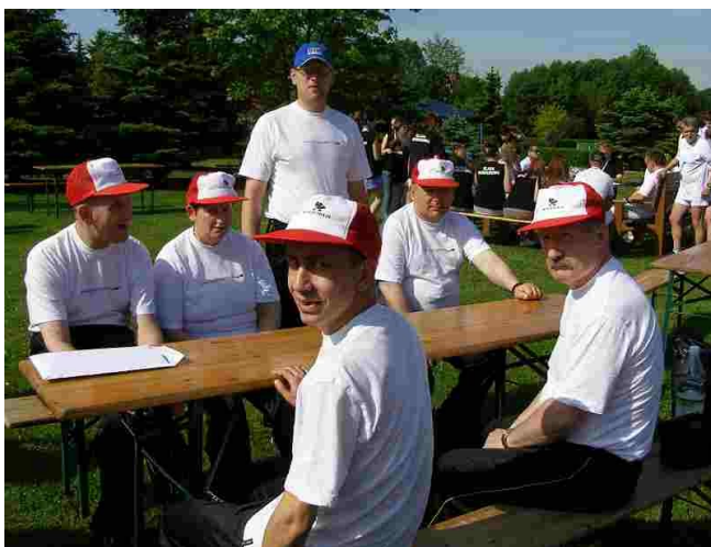
Humor dopisywał przez całą olimpiadę