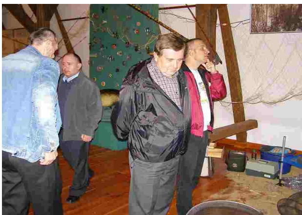
Sprzęt wędkarski, puchary, dyplomy, obrazy...naprawdę dużo eksponatów

W Belchatowskim Muzeum Regionalnym zorganizowano wystawę dla miłośników wędkarstwa. Ekspozycja pod hasłem „Historia belchatowskiego wędkarstwa. Od wędki leszczynowej do wędki grafitowej” przybliżała zwiedzającym świat związany z łowieniem ryb. Nasi podopieczni w dniach 29 i 30 kwietnia br. zwiedzili tę wyjątkową wystawę. Z dużym zainteresowaniem oglądali trofea oraz sprzęt wędkarski. Na ekspozycji znajdowały się różnorakie wędki do połowów ryb, sieci i sznury rybackie oraz spreparowane ryby, rybie łby, trofea z zawodów wędkarskich, nagrody, puchary, fotografie ryb i zbiorników wodnych, a także malarstwo, i rzeźba o tematyce wędkarskiej. Podopieczni z dużym zainteresowaniem obserwowali ryby akwariowe.