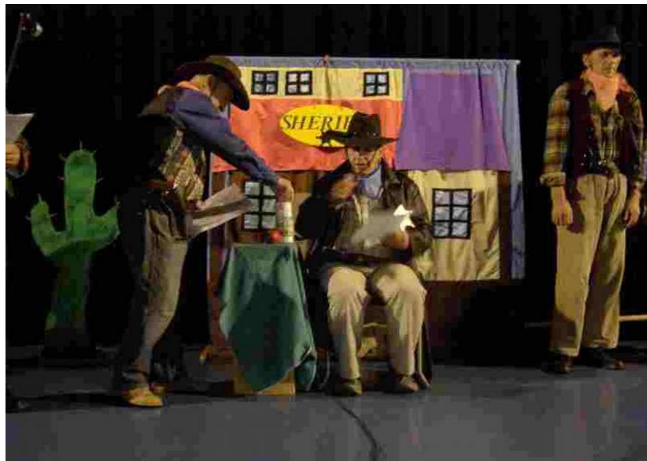
Mieszkańcy naszego DPS-u w Zabłotach coraz lepiej radzą sobie na scenie.

To już po raz czternasty Miejskie Centrum Kultury w Bełchatowie zorganizowało Przegląd Twórczości Osób Niepełnosprawnych. Jak co roku impreza ta cieszyła się ogromnym zainteresowaniem. Przybyło wiele zespołów z okolic Bełchatowa i nie tylko. Atmosfera panująca na tych spotkaniach jest wyjątkowa. Właściwie nie wiadomo czy scena jest na scenie, czy na widowni. Były takie chwile gdzie uczestnicy festiwalu i publiczność wydawały się jednym występującym zespołem. Wszyscy bawili się znakomicie. Reakcje oglądających osób były niezwykle spontaniczne.