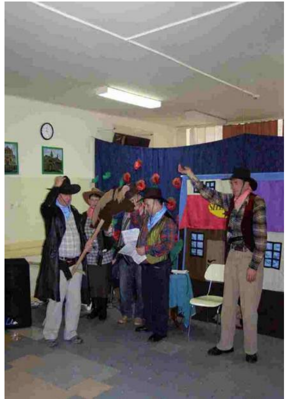
Grupa OTO ONI w swym premierowym przedstawieniu "Dziki Zachód"

W tym roku tematem przewodnim obchodów były problemy ludzi starszych. Kierownik oddziału psychiatrycznego oraz inni lekarze przybliżyli wszystkim obecnym sytuację i potrzeby ludzi w podeszłym wieku. Dowiedzieliśmy się jak można uniknąć lub walczyć z kłopotami jakie przynosi starość. Na spotkaniu oprócz występów artystycznych można było obejrzeć prace plastyczne jakie wykonują pacjenci oddziałów psychiatrycznych bełchatowskiego szpitala. Dzień zleciał nam bardzo szybko, było o czym opowiadać w Zabłotach.