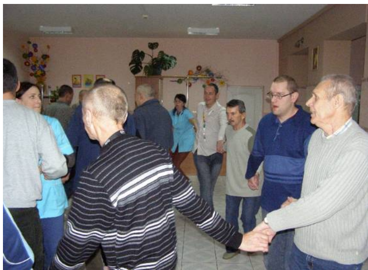
Andrzejkowa zabawa wszystkim przypadła do gustu.

najważniejszych elementów imprezy. Duża ilość osób brała czynny udział w zabawie, którą zorganizowali pracownicy terapii zajęciowej. Były różnego rodzaju wróżby i wspaniała zabawa przy muzyce tanecznej. Było dosyć tłoczno, ponieważ do zabawy przyłączyło się wielu pracowników, czuliśmy się jak w jednej wielkiej rodzinie.