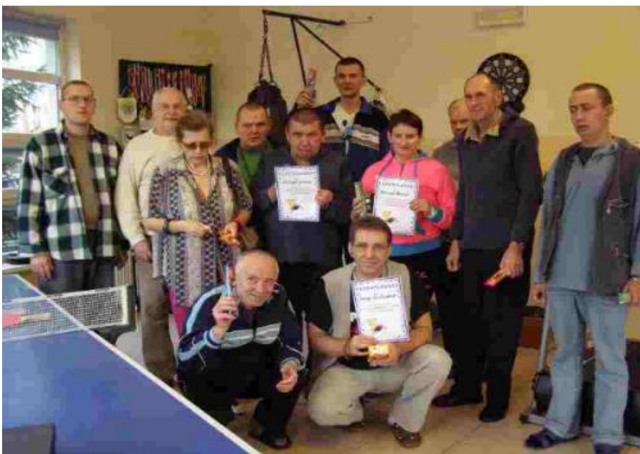
Pamiątkowe zdjęcie uczestników VII turnieju tenisa stołowego