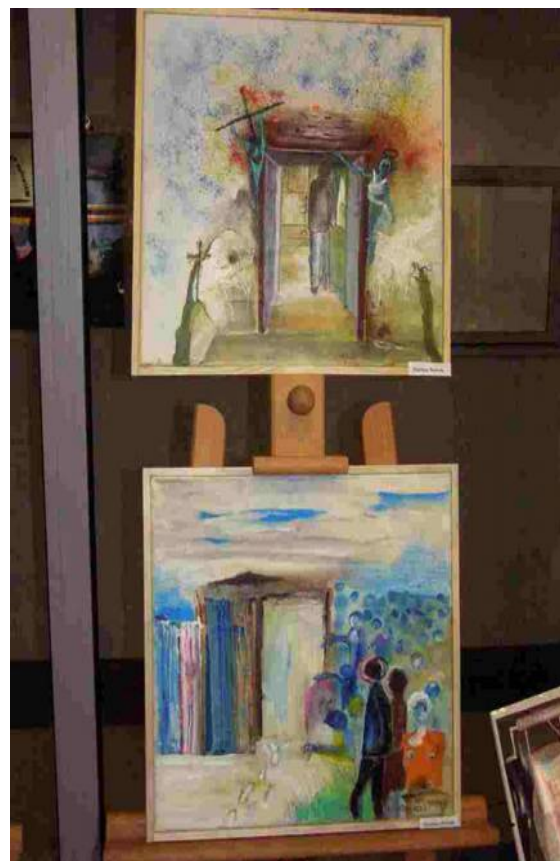
Prace pana Dariusza Nowaka przedstawione na tegorocznym przeglądzie w Bełchatowskim MCK-u