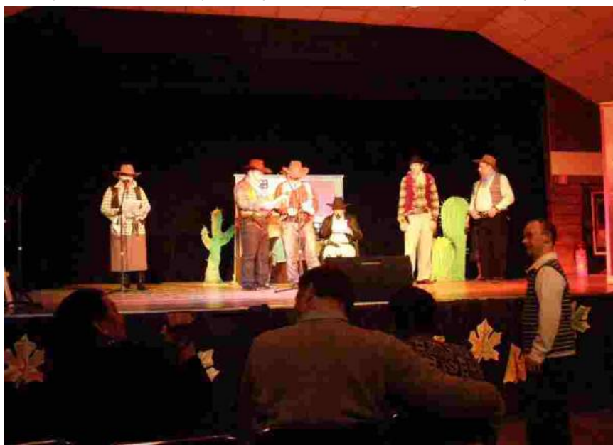
Nasza grupa teatralna podczas występów w Łodzi