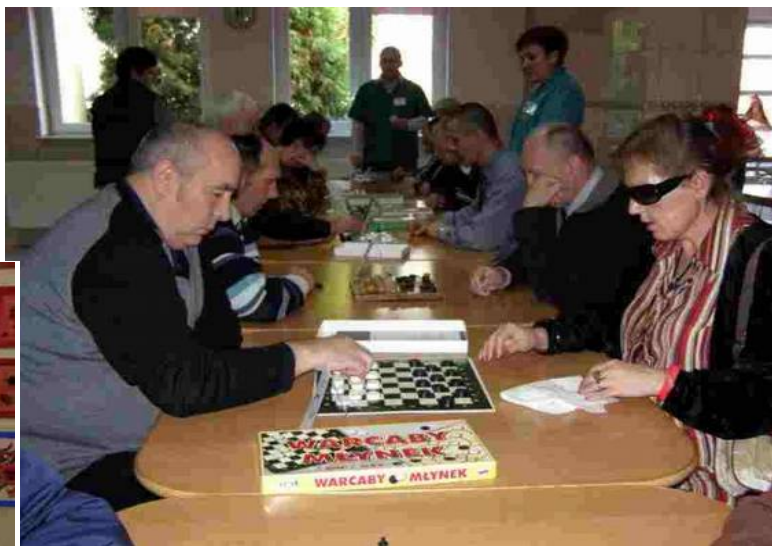
Zainteresowanie turniejem było bardzo duże.

Koniec października to pole do popisów dla naszych mieszkańców w grach stołowych. Rozgrywane są zawsze trzy konkurencje: warcaby, gra planszowa "Chińczyk" oraz gra w karty, popularny "Tysiąc". W zawodach brało udział około dwudziestu osób.