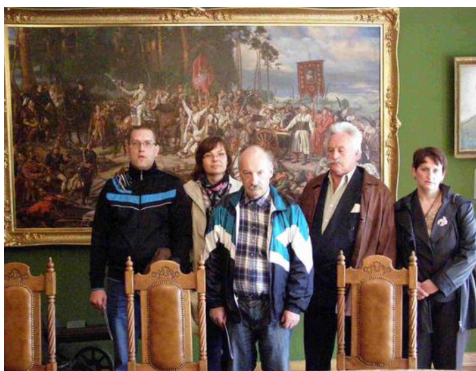
Kopia „Bitwy pod Raławicami” zrobiła na nas wszystkich duże wrażenie.

Czas spędzony w muzeum przyniósł nie tylko odpoczynek, ale również była to mała lekcja z historii i współczesnej sztuki.