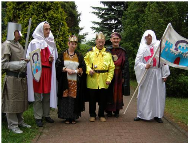
Nasi mieszkańcy w średniowiecznych strojach.

23 maja br. w Rąbieniu odbyły się warsztaty artystyczne pn. "GAWĘDA MAJOWA-JARMARK ŚREDNIOWIECZNY". Nasz ośrodek reprezentowała sześciuosobowa grupa