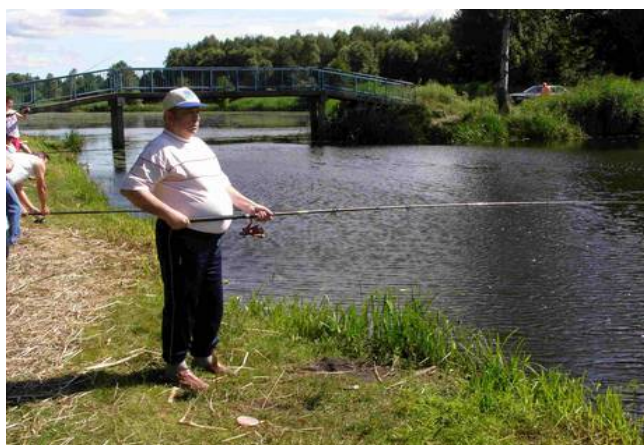
W oczekiwaniu na zdobyczną rybkę.