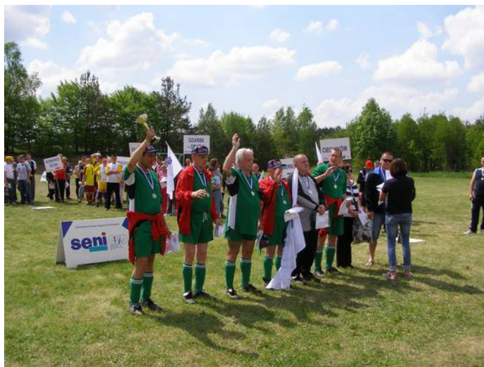
Najszcześniejszy moment turnieju - wręczenie nagród i gratulacje za zwycięstwo

Duże wrażenie na uczestnikach zrobił wieczorek artystyczny, podczas którego prezentowane były skecze oraz występy solistów i zespołów tanecznych. Uczestnictwo w tym wydarzeniu daje naszym podopiecznym możliwość rozwijania pasji sportowych. Przygotowania do turnieju trwały półtora miesiąca . Przez ten czas, pięć razy w tygodniu, dziesięciu naszych mieszkańców brało czynny udział w treningach na prowizorycznym boisku. Ważne jest to , że mogli współzawodniczyć na gruncie sportowym, kontaktować się z innymi, nawiązywać nowe znajomości. Całe wydarzenie integruje naszych domowników, a ich relacje między sobą poprawiają się . Ważną rolę pełnił personel DPS w Zabłotach, opieka i fachowa pomoc , a przede wszystkim zaangażowanie, które pozwoliło bezpiecznie oraz z sukcesem przeprowadzić przygotowania i doprowadzić do zwycięstwa w kwalifikacjach.