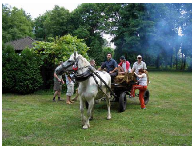
Największa atrakcja spotkania - przejazd dorożką

i zachęcając zgromadzoną publiczność do wspólnej zabawy. Wszyscy chętni mogli przejechać się „Magiczną Dorożką”, posmakować słodkich wypieków oraz przysmaków z grilla, a także potańczyć.