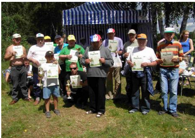
Pamiątkowe zdjęcie z dyplomami.

20 lipca br. po raz dziewiąty odbyły się Integracyjne Zawody Wędkarskie nad zbiornikiem wodnym „Patyki” koło Zelowa, w których wzięli udział mieszkańcy naszego