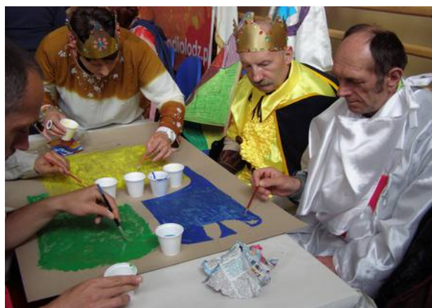
Przecież malować każdy może...

pomysł ten bardzo się spodobał. Przez półtorej godziny wszyscy uczestnicy spotkania tworzyli swoje wizje plastyczne promujące walkę o czystość na ziemi i wpajanie ekologicznego stylu życia. Cała grupa z Zabłot z dużym zaangażowaniem pracowała nad swoim pomysłem. Ze starannością i niemałym poświęceniem powstał plakat informujący jak należy segregować śmieci. Wysilek podopiecznych opłacił się. Drużyna otrzymała wyróżnienie za najciekawszy plakat. Całe spotkanie przebiegało w miłej i przyjaznej atmosferze. Gospodarze podjęli gości ciepłym posiłkiem i słodkim poczęstunkiem. Na zakończenie organizatorzy wręczyli wszystkim uczestnikom pamiątki i dyplomy za czynny