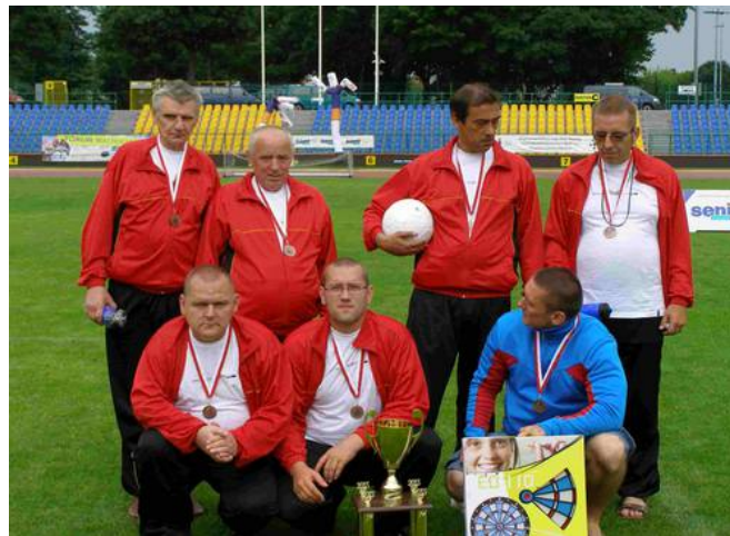
Nasza zwycięska drużyna z pucharem i nagrodą.