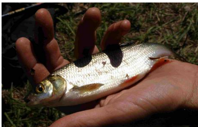
Wszyscy chcieli złowić upragnioną płotkę.