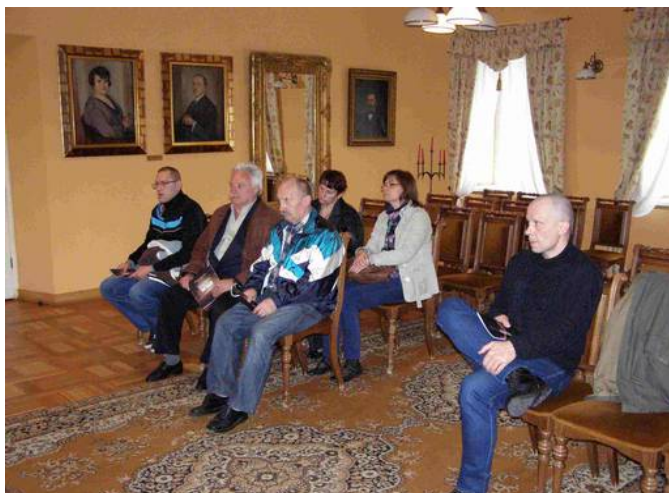
Zwiedzający w Sali Koncertowej, która obecnie pełni też funkcję Sali Ślubów.

30 kwietnia br. zorganizowana została wycieczka do Muzeum Regionalnego w Bełchatowie. Nasi mieszkańcy poznali