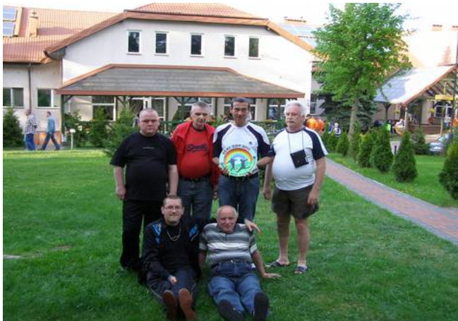
Przed turniejem nasi mieszkańcy zwiedzają ośrodek wypoczynkowy w Waplewie.

Na początku marca tego roku DPS w Zabłotach zaproszono do udziału w rozgrywkach w Międzynarodowej Lidze Piłki Nożnej Osób Niepełnosprawnych SENI Cup. Nasza reprezentacja od 14 do 16 maja grała w miejscowości Waplewo ( woj. warmińsko-mazurskie). Pierwszego dnia