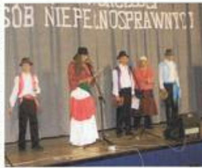
Nasz „Tabor Cygański”

W dniu 25.10.2007 r. wzięliśmy udział w przedstawieniu w którym wystąpiła nasza grupa artystyczna „Tabor cygański”. Była bardzo miła atmosfera. Wystąpiło wiele grup artystycznych i tanecznych. Publiczność była bardzo liczna a także z zaciekawieniem śledzili występy. Ze zdumieniem i zachwytem wszyscy oklaskiwali występy co podtrzymało nas na