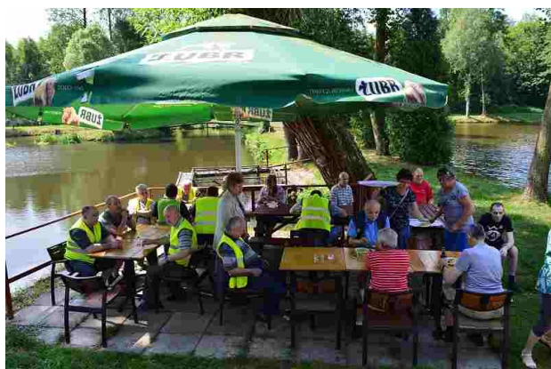
Nad wodą zawsze jest przyjemnie

5 czerwca br. po raz kolejny udaliśmy się do pobliskiej smażalni ryb „Stary Młyn” w miejscowości Jamborek. Pogoda w tym dniu dopisała, więc część mieszkańców na wycieczkę wybrała się rowerami, a część poszła pieszo. Po dotarciu na miejsce na wszystkich czekała smaczna smażona rybka z dodatkami. Był to dla wszystkich mile spędzony czas.