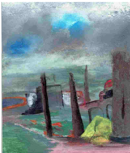
„Ruiny Imperium” akryl, suche pastele