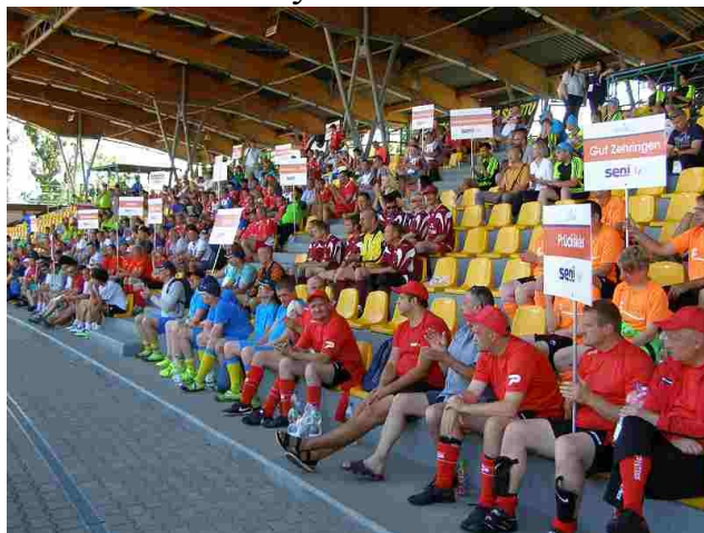
Trybuny były zawsze zapelnione

Po przejściu turnieju w Waplewie nasza drużyna piłkarska zakwalifikowała się do udziału w Międzynarodowym Turnieju Piłki Nożnej Osób Niepełnosprawnych Seni Cup 2018 w Toruniu. Rozgrywki odbyły się w dniach 3 - 5 lipca br. Brały w nim udział 33 drużyny z 11 krajów. Z wszystkich rozegranych meczy nasi zawodnicy przegrali tylko jeden 5:2 z drużyną z Grudziądza. Ta przegrana przesądziła o zajęciu przez nas drugiego miejsca. Królem strzelców w naszym składzie został pan Krzysztof, natomiast za bardzo udany debiut można uznać