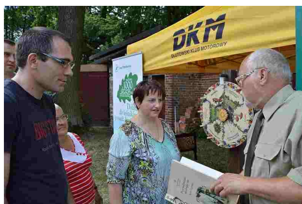
Wylosowane pytania nie zawsze były łatwe

oraz zawody zrecznościowe. Natomiast przedstawiciele z Nadleśnictwa Kolumna