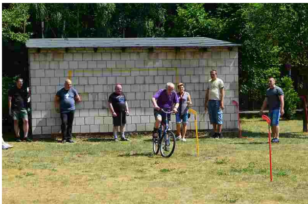
W trakcie rowerowego slalomu

21 czerwca w naszym domu uczciliśmy nadejście upragnionego lata. Pogoda w tym dniu dopisała, było bardzo