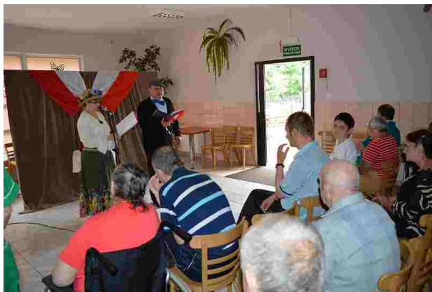
Ten spektakl był małą lekcją historii

12 czerwca w naszym domu gościliśmy aktorów z Krakowa, którzy zaprezentowali nam spektakl literacko - muzyczny pt. "Spełnione sny" związany tematycznie z przypadającą w tym roku