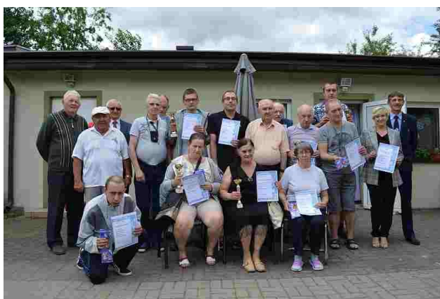
Wspólne pamiątkowe zdjęcie