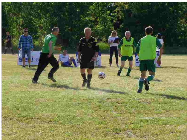
Nasi piłkarze w akcji

23-25 maja br. drużyna piłkarska naszego domu wzięła udział w XVIII turnieju kwalifikacyjnym