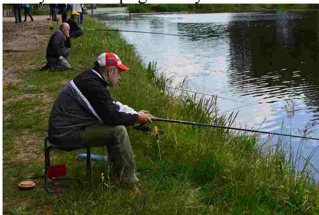
W oczekiwaniu na upragnioną rybkę

23 czerwca, dzień po rozstrzygnięciu konkursu plastycznego, ponownie spotkaliśmy się z przedstawicielami koła wędkarskiego z Zelowa na zawodach wędkarskich nad zbiornikiem „Patyki”. W tym roku pogoda była zmienna co