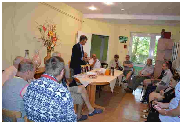
Ogłoszenie wyników konkursu