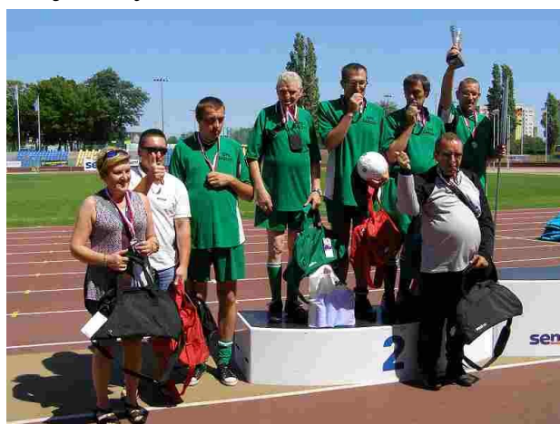
Nasza drużyna na podium

aby każdy z uczestników był zadowolony z pobytu. Bardzo cieszymy się z osiągniętego wyniku - gratulujemy całej drużynie oraz trenerowi!