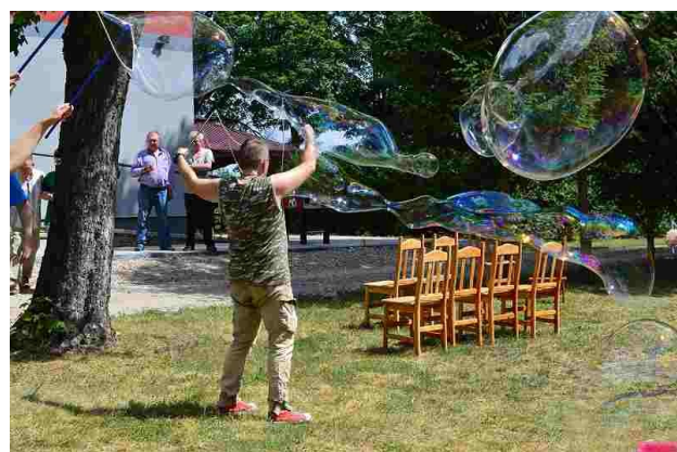
Puszczanie baniek to zawsze super zabawa

19 czerwca udaliśmy się do ŚDS Drzewociny na piknik integracyjny. Na zaproszonych gości czekało wiele