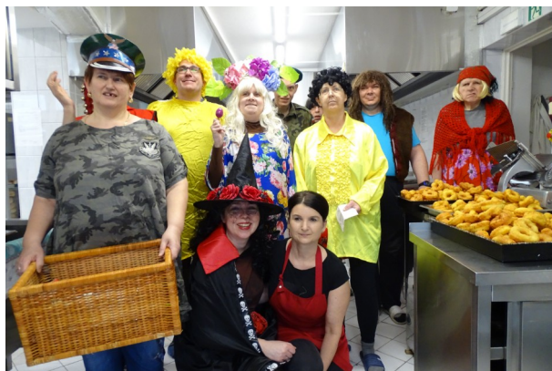
Na kuchni zawsze są pyszne wypieki

medyczny, pracowników socjalnych oraz kuchnię. Barwnemu orszakowi towarzyszyły wesołe przyśpiewki, co wywołało wiele radości i uśmiechu na twarzach. Świętowanie zakończyliśmy tradycyjnymi ostatkowymi wypiekami takimi jak pączki i faworki. Pożegnanie karnawału upłynęło w radosnej atmosferze.