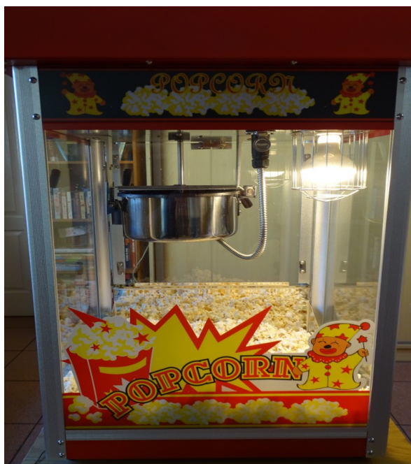
Z nowej maszyny popcorn najsmaczniejszy

19 stycznia obchodziliśmy Dzień Popcornu. Z tej okazji został zorganizowany seans filmowy połączony z degustacją prażonej kukurydzy. W ramach kącika kulinarnego mieliśmy okazję wypróbować nową maszynę do przygotowania świeżego popcornu. W tym dniu mieszkańcy próbowali dwóch smaków: klasycznego słonego i nietypowego serowego. Podopieczni obejrzeli kultową polską komedię Stanisława Barei pt. „Poszukiwany, poszukiwana”, ze wspaniałą grą aktorską Wojciecha Pokory. Była to bardzo ciekawa forma spędzania czasu wolnego, a obejrzana komedia wywołała pozytywne emocje, wprowadziła nas w dobry humor i dostarczyła tematów do rozmów.