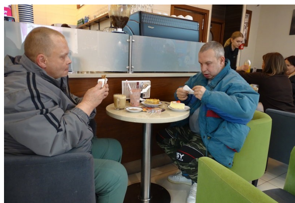
Po seansie czas na słodkie małe co nieco