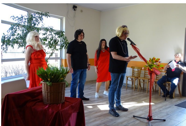
...Czym byłby świat, gdyby Was nie było?...

znanych utworów muzycznych. Cały występ był pełen humoru i wspaniałej zabawy. Na twarzach wszystkich Pań pojawił się uśmiech oraz entuzjizm do wspólnego śpiewania. W tym dniu skierowano do pań wiele ciepłych słów, a na koniec występu wręczono symbolicznego tulipana. Dopełnieniem przyjemnej atmosfery było spotkanie przy kawie i słodkim poczęstunku.