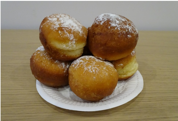
Najsmaczniejsze są świeże pączki...

zwyczaj i właśnie tego dnia tj. 12 lutego na stołach pojawiły się przepyszne pączki wykonane przez niezawodne panie z kuchni. Ten najśłodszy dzień w roku wspólnie spędziliśmy przy kawie, w dobrych humorach i miłej atmosferze.