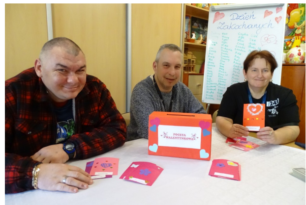
Każdemu możemy sprawić niespodziankę