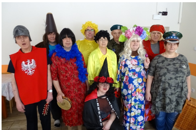
Nasz barwny korowód ostatkowy

Ostatki to ostatni dzień karnawału, czas radości i wspólnego świętowania. W tym dniu 17 lutego tradycyjnie jak co roku został zorganizowany barwny korowód przebrańców. Uczestnicy w kolorowych strojach przemaszerowali przez pomieszczenia naszego domu, odwiedzając pokoje mieszkańców, administrację, personel