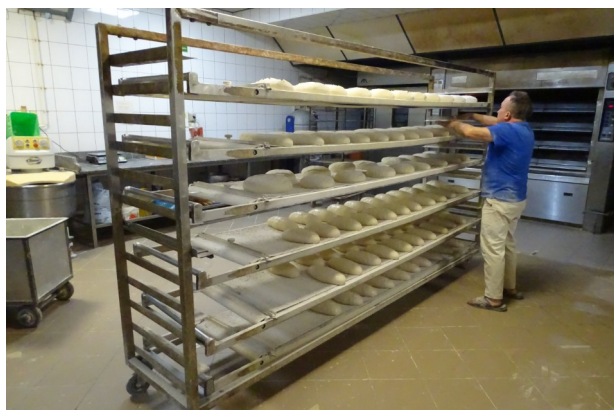
Przeglądaliśmy się pracy piekarza

do pracy piekarza. Dowiedzieliśmy się, że wypiekane są różne rodzaje chleba w zależności od rodzaju mąki i różnych dodatków (nasiona, suszone owoce), które wzbogacają smak, i wygląd pieczywa. Na zakończenie każdy mieszkaniec został poczęstowany świeżą, jeszcze ciepłą bułką. Dziękujemy właścicielom firmy za miłe przyjęcie, poznanie tradycyjnego wypieku chleba oraz otrzymanie słodkiego upominku.