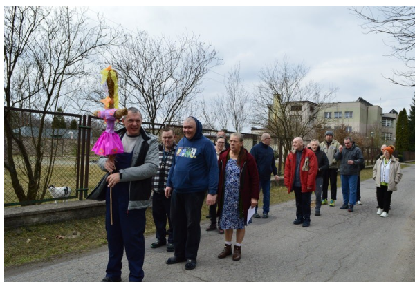
Spacer w poszukiwaniu wiosny

Wielkanoc to czas otuchy i nadziei. Czas odradzania się wiary w siłę Chrystusa i drugiego człowieka. Życzymy, aby Święta Wielkanocne przyniosły radość oraz wzajemną życzliwość. By stały się źródłem wzmacniania ducha. Niech Zmartwychwstanie, które niesie odrodzenie, napelni pokojem i wiarą, niech da siłę w pokonywaniu trudności i pozwoli z ufnością patrzeć w przyszłość... Zdrowych i Radosnych Świąt Wielkanocnych