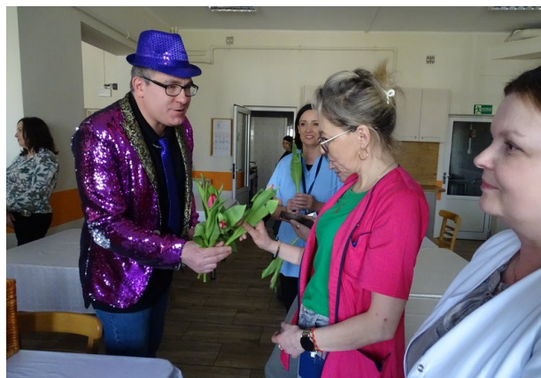
...Dla Was dzisiaj kwiaty, kochamy Was...