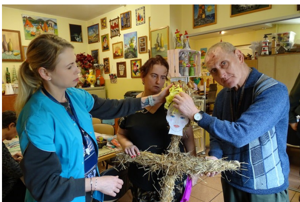
Tak powstawała nasza Marzanna

pierwszych oznak wiosny. Podczas spaceru udaliśmy się do pobliskiego zbiornika wodnego, aby utopić symboliczną zimę i powitać upragnioną wiosnę. Od tej pory oczekujemy na przyjscie cieplejszych dni co na pewno poprawi nam samopoczucie.