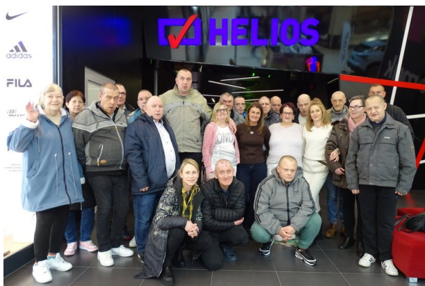
Uczestnicy wycieczki do kina

Ten pełen ciepła film ukazał, iż na miłość nigdy nie jest za późno, a drugą połowę można znaleźć w każdym wieku. Po seansie cała grupa udała się na lody, ciasto i kawę. Przyjemnie spędziliśmy piątkowe przedpołudnie.