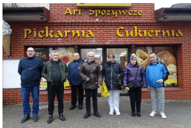
Po wizycie wspólne zdjęcie przed piekarnią