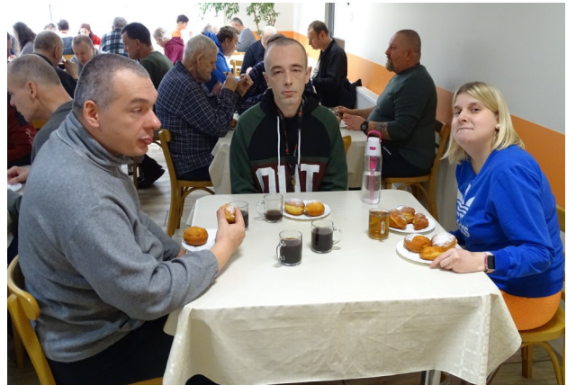
...i kawka w miłym towarzystwie