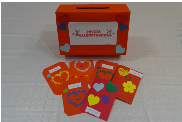
Kolorowe kartki walentynkowe

walentynkowe, uczestniczyli w zajęciach grupowych podczas których rozwiązywali quizy, zagadki i rebusy. Wszyscy chętni wrzucali swoje walentynki do specjalnie przygotowanej „poczty walentynkowej”, a następnie korespondencja trafiła do adresatów, sprawiając wiele radości i uśmiechu. Był to dzień pełen serdeczności i życzliwości.